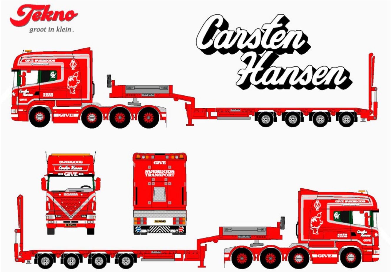
T5047Hansen , Scania Longline mit 4achs Tieflader Goldhofer Carten Hansen, Dänemark, Auslieferung Juli 2006, max. Anzahl 750 Stück Richtpreis 225,00 €uro