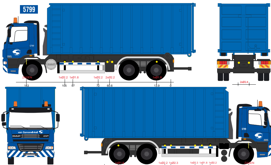
T1543 Gansewinkel DAF CF mit Abrollkipper Auslieferung ca. Jan. 2007, Auflage 200 Stück Richtpreis 140,00 € Richtpreise können sich verändern - werden erst nach Fertigstellung fest