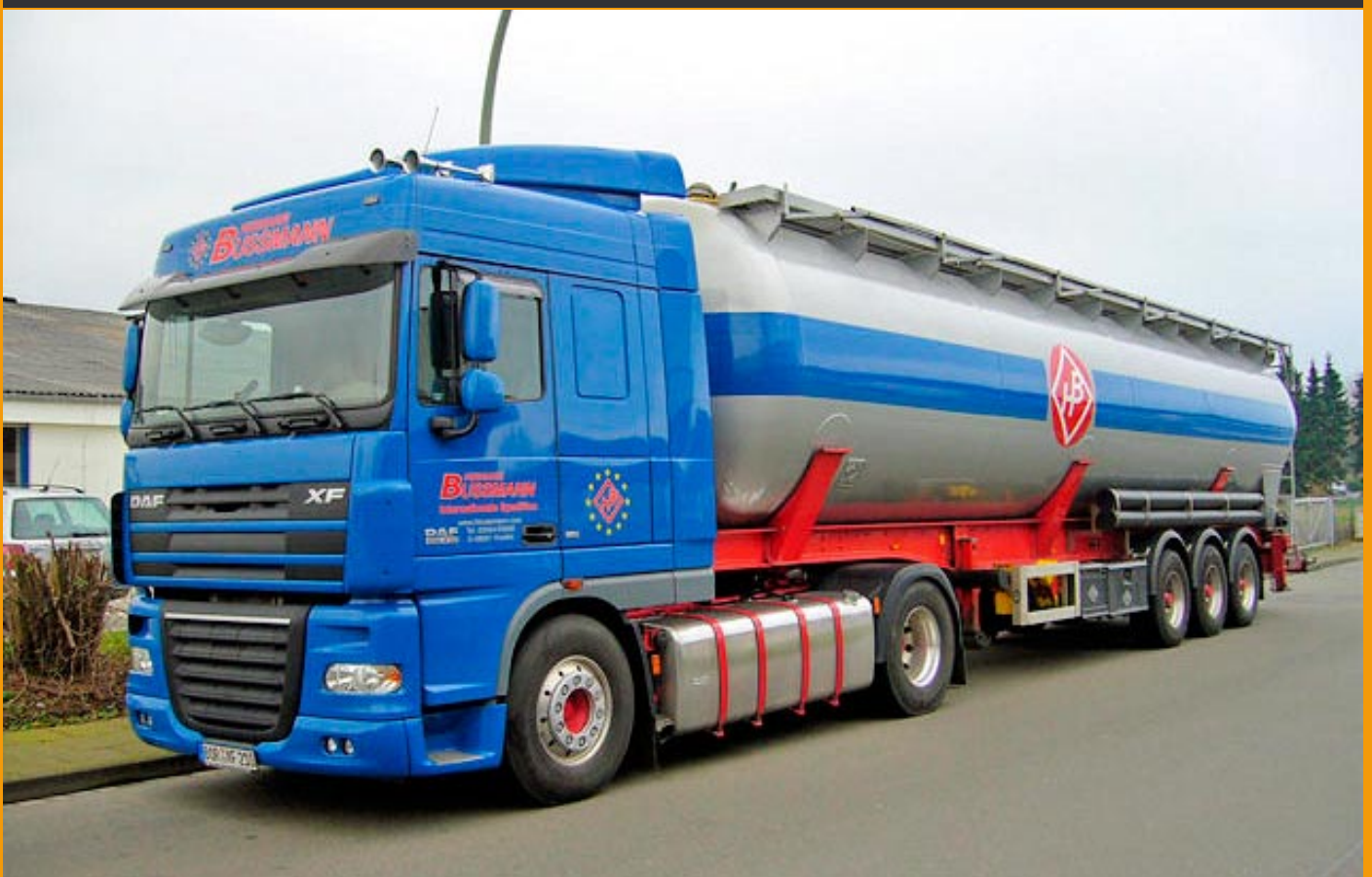
LT20211Bussmann, DAF XF105 mit Kippsilo, 110,00 € Auflage 100 Stück, Lieferung ca. 4. Quartal 2008