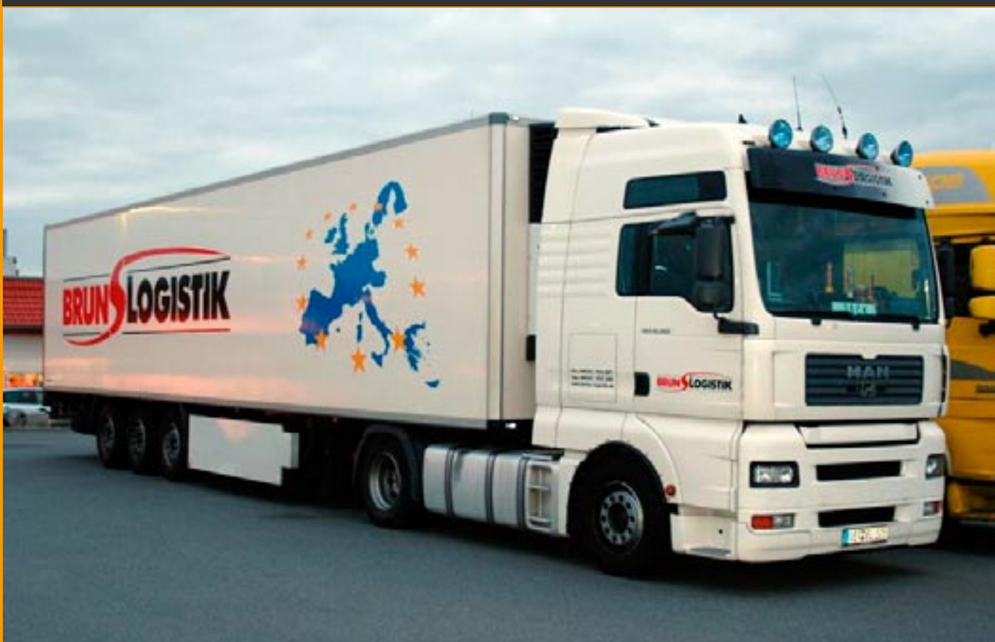
LT79205Bruns MAN TG-A XXL mit Kühlkoffer, 110,00 € Auflage 100 Stück, Lieferung ca. 2/3. Quartal 2008