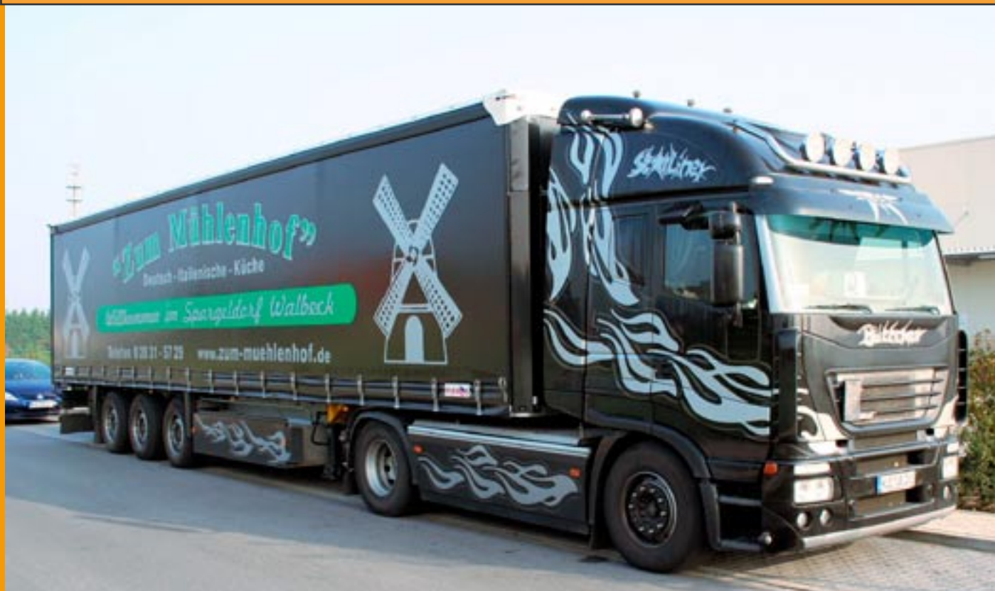
LT89218Böttcher, IVECO Stralis mit Gardinenplaen 125,00 € Auflage 100 Stück, Lieferung ca. 2. Quartal 2008