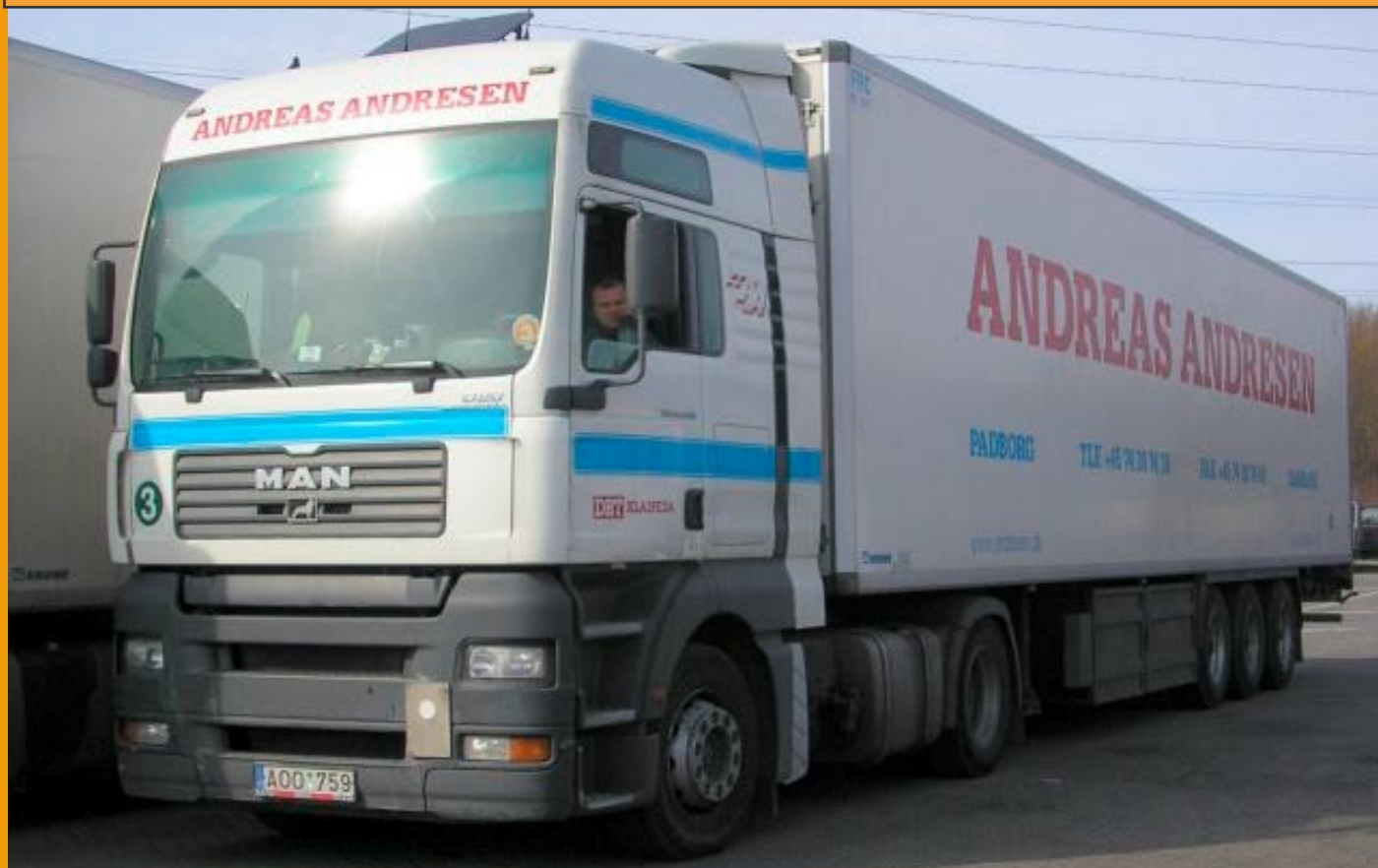
LT79205Andresen, MAN TG-A XXL mit Kühlkoffer 130,00 € Auflage 200 Stück, Lieferung ca. 2. Quartal 2008