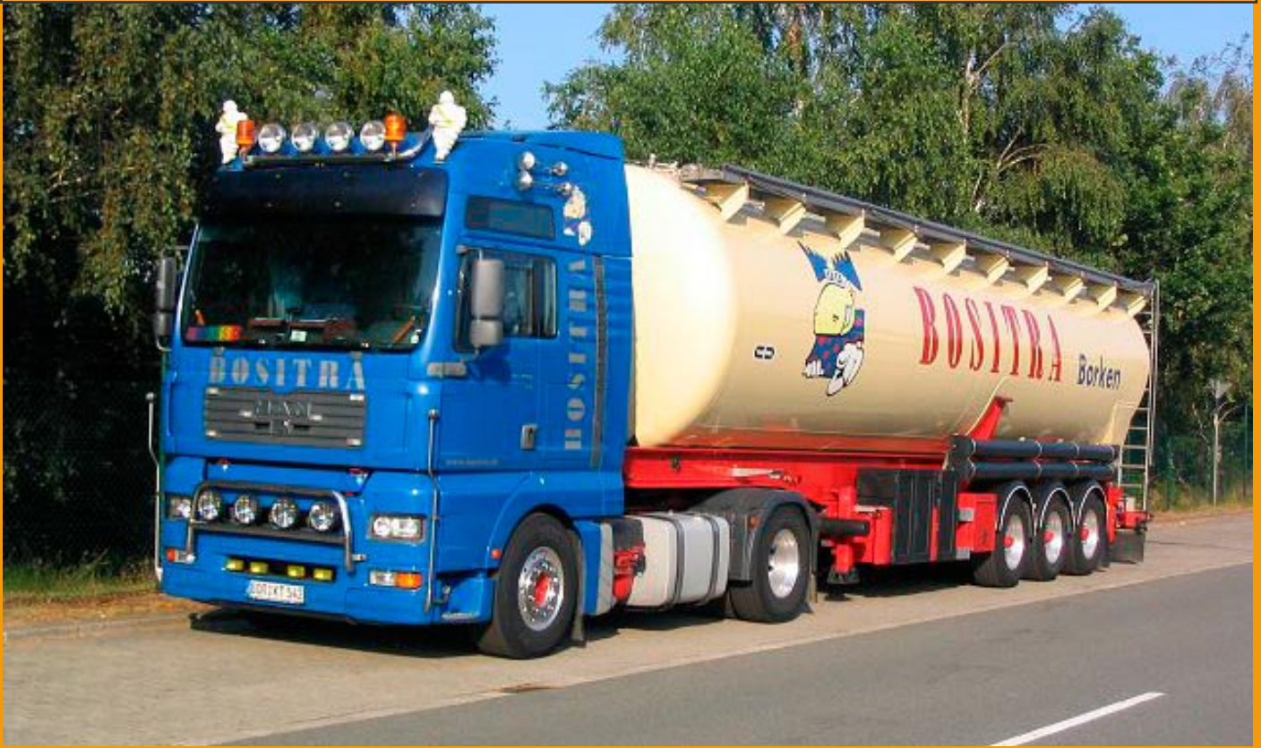
LT79211Bositra, MAN TG-A XXL mit Kippsilo 130,00 € Auflage 100 Stück, Lieferung ca. 4. Quartal 2008