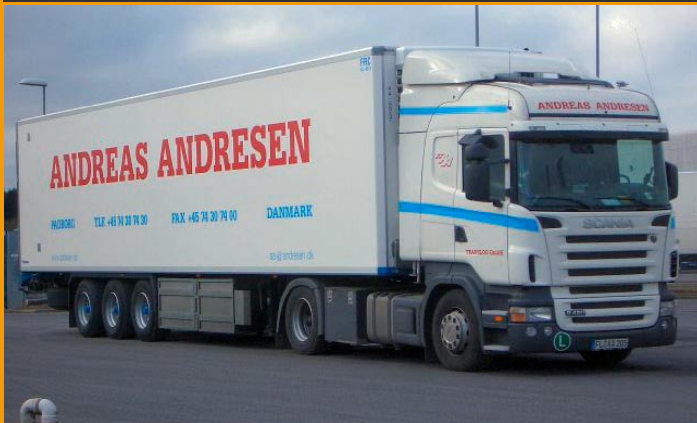
LT56205Andresen Scania R Highline mit Kühlko., 125,00 € Auflage 200 Stück, Lieferung ca. 2. Quartal 2008