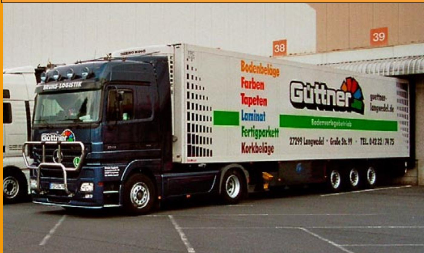
LT69205Bruns, MB-Actros LH mit Kühlkoffer 130,00 € Auflage 100 Stück, Lieferung ca. 2/3. Quartal 2008