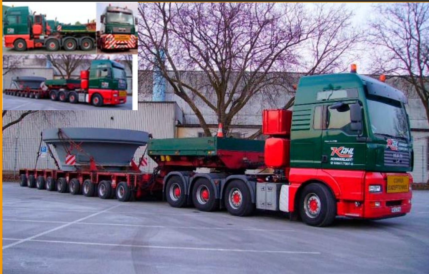
LT79408Kahl MAN TG-A XXL 660 mit 8achs-Tieflader, 125,00 € Auflage 100 Stück, Lieferung ca. 2/3. Quartal 2008